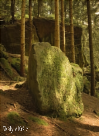
Skály v Kršle

Ještě níže v údolí Pulčinského potoka se nachází poslední skalní lokality okolí Pulčína, a to poměrně málo známé Skály v Kršle , přerušované skalní val o délce asi sto metrů s věčně mokřými stěnami, jejichž výška nepřesahuje deset metrů. Jen pár stovek metrů od těchto skal je malá osamocená skalka s názvem Sýkorka , tyčící se v lese nad zatáčkou cesty k Pulčínu od Pulčinského mostu.