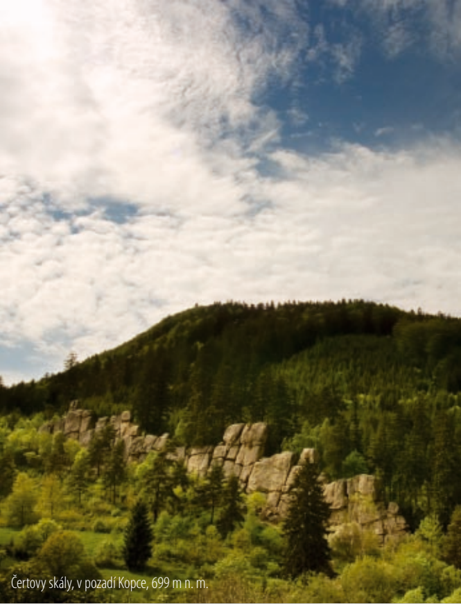
Čertovy skály, v pozadí Kopce, 699 m n. m.

Nejznámnějším skalním útvarem na Hornolidečku jsou bezpochyby Čertovy skály , výrazná dominantanta údolí Senice i samotné obce Lidečko . Tvoří je 150 metrů dlouhá pískovcovo-slepencová lavice s údolními stěnami vysokými až 25 metrů. Čertovy skály jsou jedním z nejvýznamnějších lezeckých terénů oblasti moravských pískovcových skal a většinu roku je zde možno vidět v akci desítky lezců. Jsou specifické svou zvláštní strukturou umožňující jedinečné možnosti lezení na tření. Z tohoto pohledu jde o jednu z nejobtížnějších oblastí na Moravě (lezecké cesty v téměř hladkých plotnách zde dosahují až 9. stupně stupnice mezinárodní horolezecké federace UIAA). První výstupy zde vznikaly již ve čtyřicátých letech, avšak největším rozmachem horolezectví prošly skály v letech šedesátých a hlavně osmdesátých. Lokalita je chráněnou přírodní památkou a horolezecky ji mohou za stanovených podmínek využívat pouze horolezci s platným průkazem ČHS, případně s průkazem jiné organizace sdružené pod mezinárodní horolezeckou organizaci UIAA.