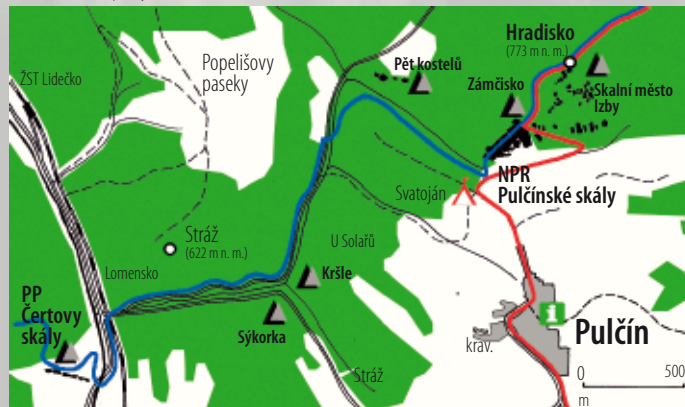
Orientační náčrt okolí Pulčinských skal

II. Francova Lhota – Lidečko: Francova Lhota, po červ. zn. do Pulčína – Pulčinské skály – Hradisko, dále zpět po modré zn. do Lomenska a dále po cestě I/57 – Lidečko (žel. st. Lidečko). Celkem 10 km; převýšení 350 m.