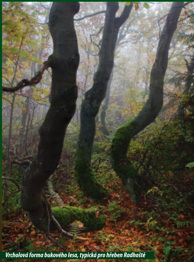
Vrcholová forma bukového lesa, typická pro hřeben Radhoště

Na severním úbočí hory se nachází Národní přírodní rezervace Radhošť, která byla vyhlášena v roce 1955 a na NPR přehlášena v roce 1989. Chrání rozsáhlý komplex porostů na vrcholových partiích hory, vystavený v hřebcových polohách severních a severovýchodních svahů velmi nepříznivým klimatickým vlivům, zejména sněhu, větru a námraze. Území bylo zařazeno do mezinárodního programu CORINE – biotopy.