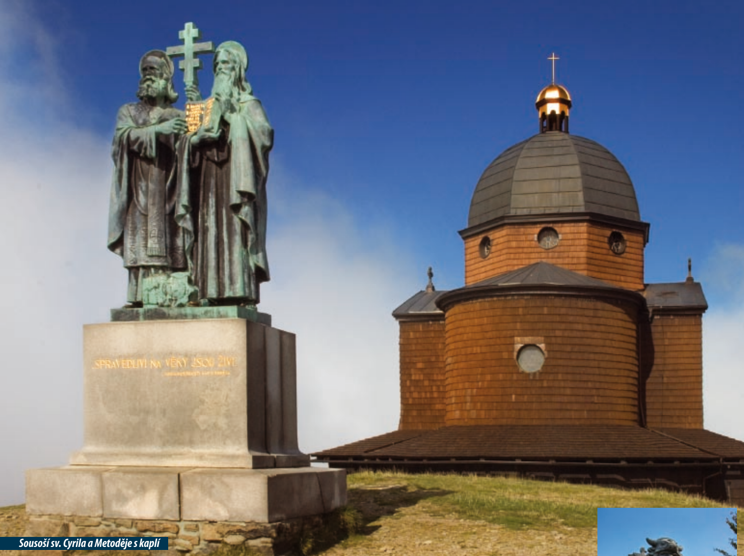
Sousoší sv. Cyrila a Metoděje s kaplí

Radhošť, jedna z nejvyšších hor Beskyd (1129 m n. m.), je pro svou relativně snadnou dostupnost vyhledávaným výletištem. Nejvíce frekventovaným turistickým východiskem jsou Pustevny, kam je možno se dopravit lanovkou z Trojanovic, případně veřejnou nebo individuální dopravou z Prostřední Bečvy. Samotný vrchol hory je oblíbené poutní místo s kaplí a sousoším sv. Cyrila a Metoděje a horským hotelem Radegast. Za dobré viditelnosti odtud můžete vidět kromě přilehlých hor také Biele Karpaty, Jeseníky, Malou Fatru a částech i Západní Tatry.