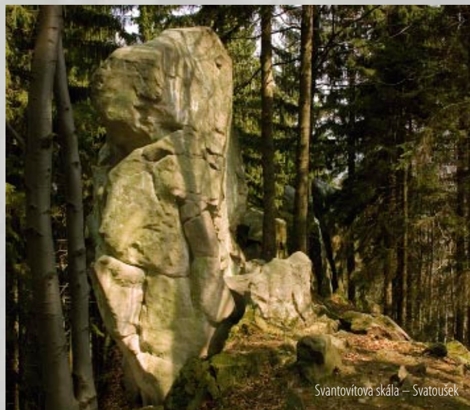
Svantovítova skála – Svatoušek

Z horolezeckého hlediska jde o nejzajímavější skalní útvar v okolí vrchu Klenov. Jedná se o šedesátimetrovou skalní zeď rozdělenou do tří věží (Ploutev, Svatka a Svatoušek), která je vyvrcholením skalního hřebetu od vrcholu Štípa (707 m n. m.). Lokalita byla lezecky objevena až v 60. letech a v současnosti je zde vytyčeno kolem třiceti lezeckých cest převážně středních a vyšších stupňů obtížnosti ve stěnách do výšky deseti metrů. Z vrcholu Ploutve je nádherný výhled na údolí Malé Bystřice, Santov a Búřov. Dosažení vrcholu bez horolezecké výbavy však není jednoduchou záležitostí.